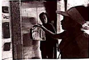
多名业主反映曾被困电梯

海都讯(记者 毛朝青 文/图) 昨日,福州市民刘先生通过智慧海都平台报料称,20日下午,在闽侯南通镇通洲花园,一名老人被困电梯50多分钟。