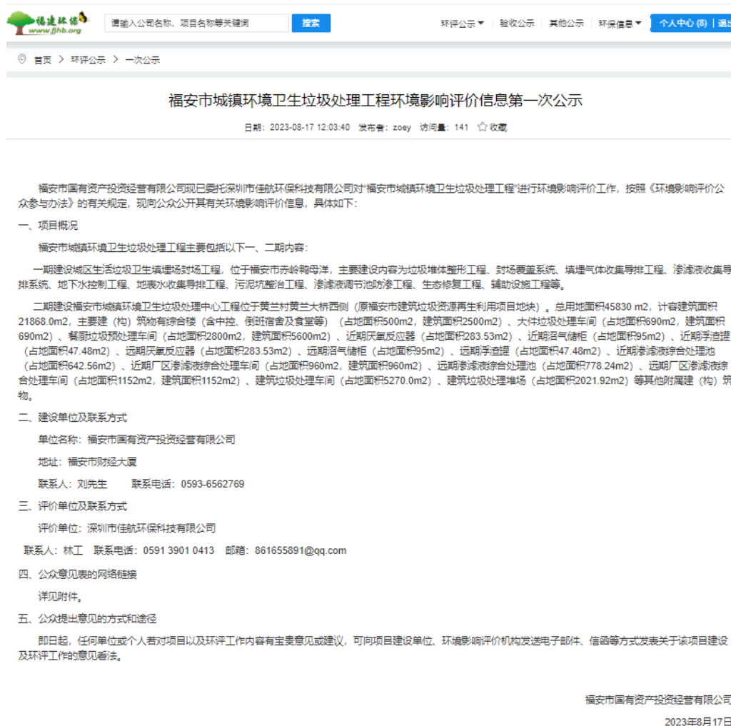
图1 首次环境影响评价信息公开截图

我司于2023年8月17日在全国建设项目环境信息公示平台进行了首次环境影响评价信息公开，公示情况详见图1，网址链接： https://www.fjhb.org/huanping/yici/23487.html 。