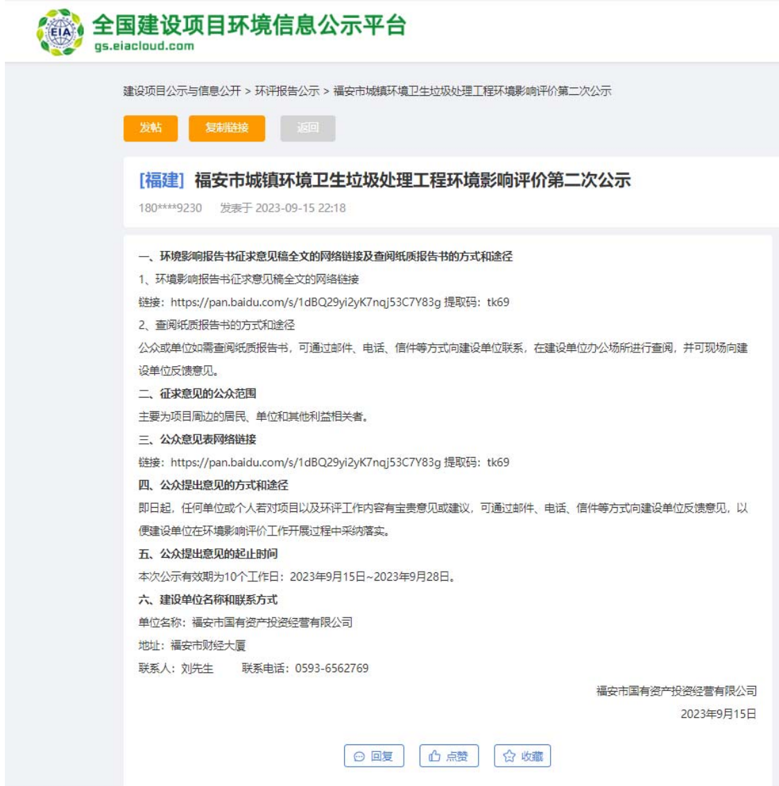
图 2 征求意见稿公示截图

建设单位于 2023 年 9 月 15 日~2023 年 9 月 28 日在全国建设项目环境信息公示平台进行了征求意见稿环境影响评价信息公开，征求意见稿网络公示截图见图 2，网址： https://www.eiacloud.com/gs/detail/1?id=30915qUaSz 。