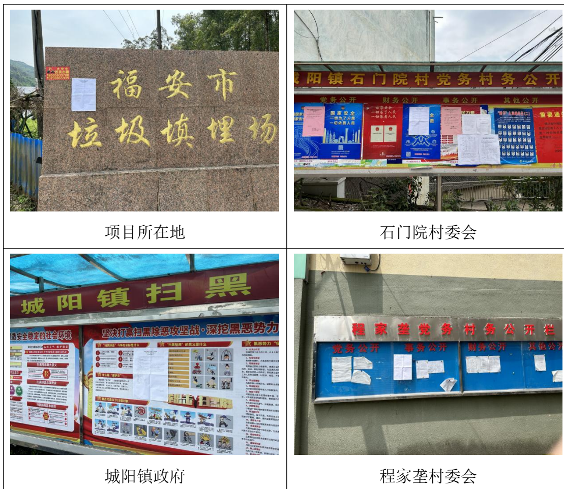
图 4 周边村庄公示截图（张贴）