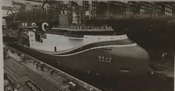
4月20日,深远海多功能科学考察及文物考古船在广州出坞

这艘深远海多功能科学考察及文物考古船总投资约8亿元,建造内容包括船舶系统、载人深潜水面支持系统和综合科考作业系统等。该船续航力15000海里、载员80人。此次出坞后,将开展设备调试和系统联调、船舶海试和科考设备海试等,预计于2025年完