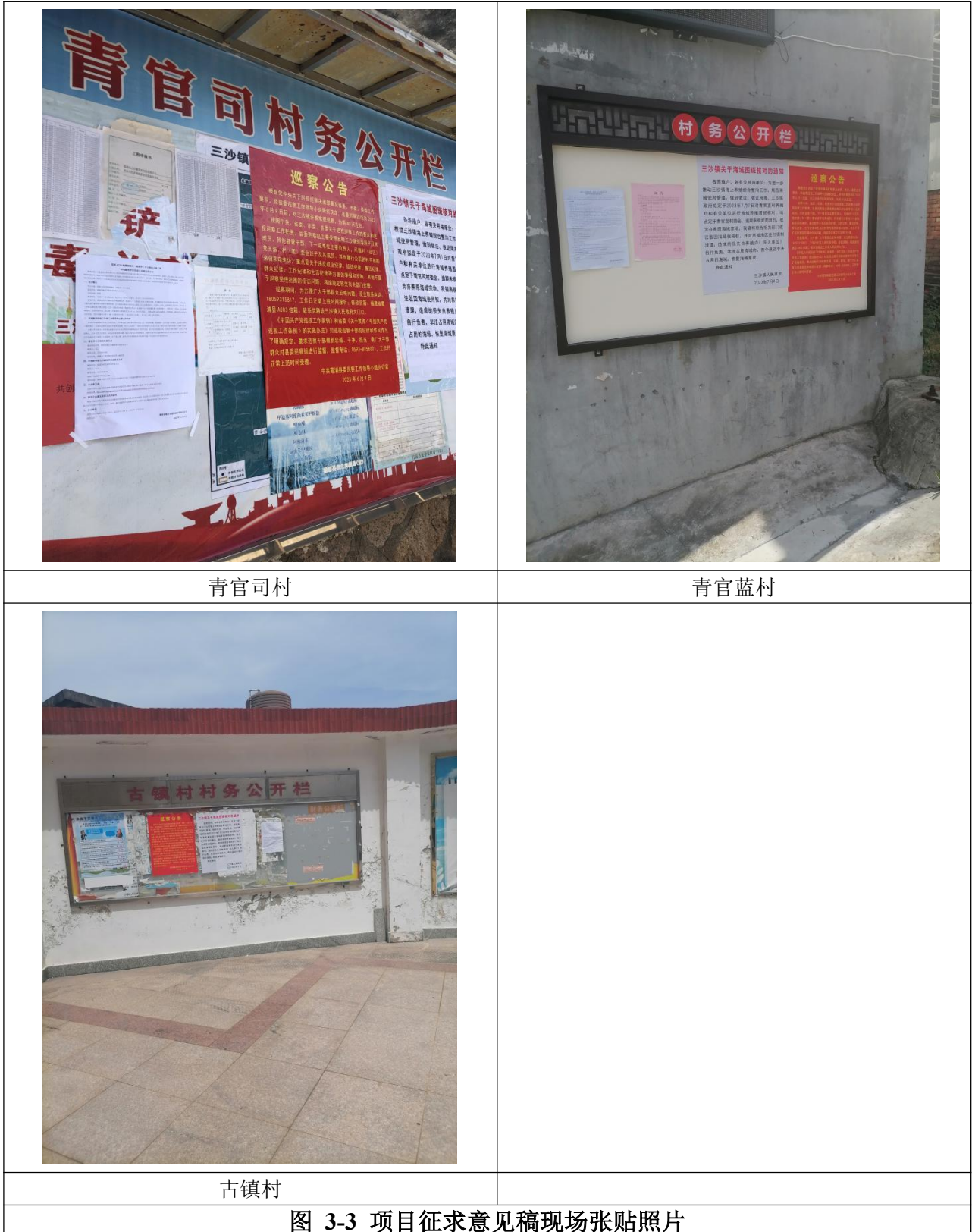
图 3-3 项目征求意见稿现场张贴照片

本项目编制征求意见稿后在进行网络公示、登报公示的同时，同步进行现场张贴公示。我单位在青官司村、青官蓝村、古镇村宣传栏张贴公告，公示期限为2024年4月18日~4月30日，具体详见下图。